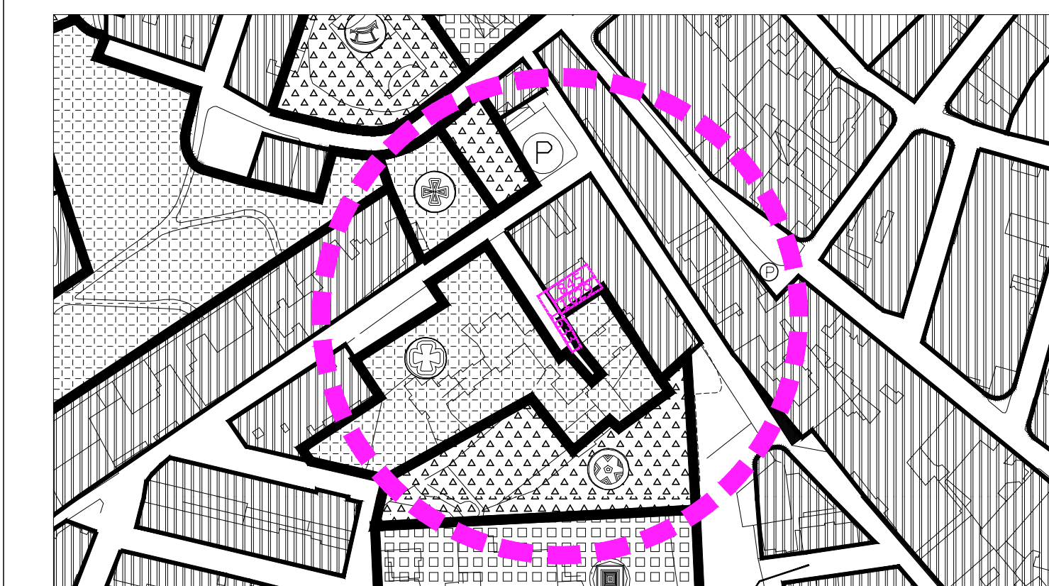
PARTICOLARE SCALA 1:2000

ELABORATI REDATTI A CURA DELLA D&C - ARCHITETTURA E INGEGNERIA S.R.L. Arch. Angelo Dezio