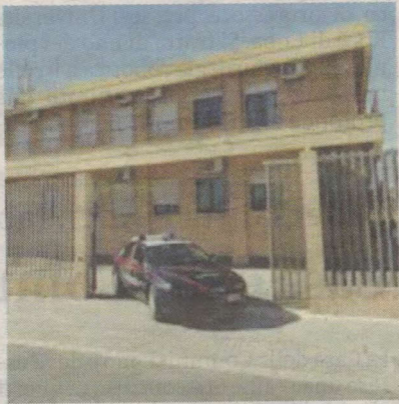
La caserma dei carabinieri