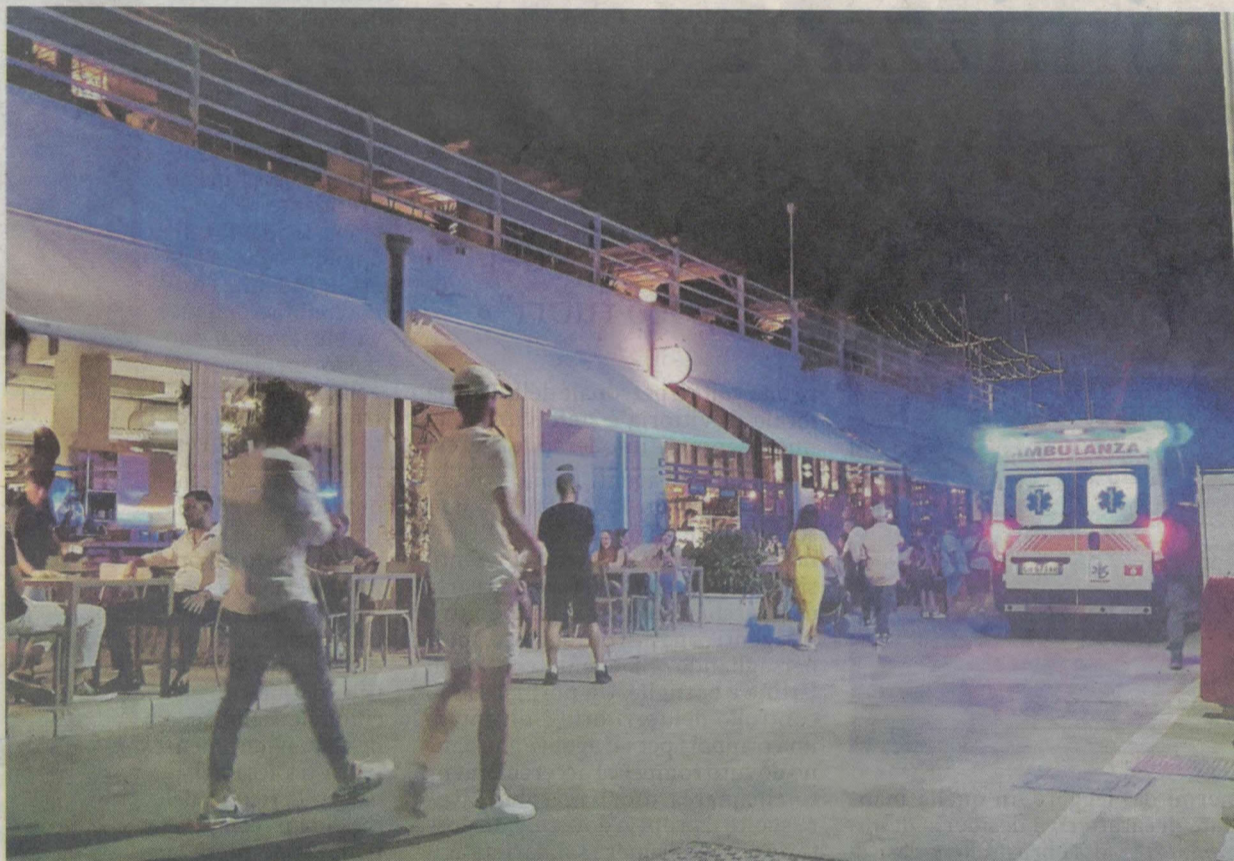
La polizia ha identificato e denunciato gli autori del parapiglia nel Porto turistico di Marina di Ragusa