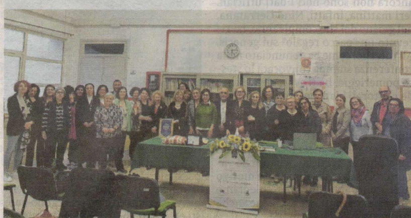
Il momento conclusivo del corso di formazione

«Rivoluzioni silenziose che passano attraverso il sapere e la conoscenza e, dunque, dalla lettura di un libro, e altre dal prendersi cura del mondo e di se stessi, con fermezza e gentilezza, valori che le donne sanno declinare in una maniera tutta loro, come ha affermato la scrittrice Dacia Maraini, presente all'incontro conclusivo del corso di formazione che ha visto l'attiva partecipazione di oltre ottanta docenti» conclude Minardi.