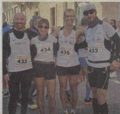
Il quartetto della Running Modica