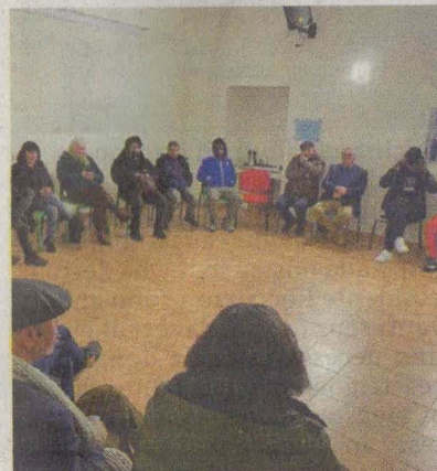
L'assemblea tenutasi ad Acate

«Tutto senza dimenticare la battaglia per Daouda - ribadisce Mililli - Riusciremo a mettere in campo anche l'aspetto legale legato alla vicenda, per creare un tavolo contro il caporalato e lo sfruttamento reale e fatto da organizzazioni che si battono sul territorio per questo, che non sia semplicemente aleatorio come, purtroppo, viene dimostrato dal tavolo contro il caporalato che è in Prefettura».