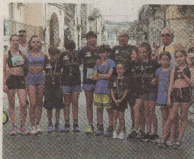
La Libertas Scicli di Ruscica a Modica