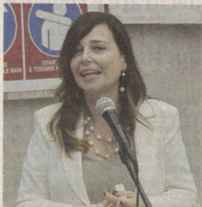
L'assessore Daniela Baglieri

Domani sera non sarà possibile conferire, ancora una volta, l'indifferenziato. La situazione di emergenza è scattata venerdì scorso, quando un provvedimento giudiziario ha disposto la chiusura della discarica Oikos. Il Tmb di Ragusa è chiuso, perché già saturo, quindi il servizio sarà effettuato esclusivamente per le seguenti utenze non domestiche: attività ristorative, bar, attività ricettive, rsa, strutture sanitarie. Sarà inoltre garantita la raccolta di pannolini e pannoloni anche delle abitazioni private. Tutte le altre utenze sono invitate a non esporre i relativi mastelli. Interpellata sull'argomento, l'assessore regionale all'Energia, Daniela Baglieri, martedì sera a Ragusa per il convegno della Cna, ha risposto: «Il problema è dell'intero sistema: la regione da una parte e dall'altra i comuni e le srr. Il problema dipende anche dal fatto che l'equilibrio è molto precario e quindi attualmente grazie alla disponibilità di tutti gestori, si è trovata una soluzione tampone che è quella di portare i rifiuti fuori perché altrimenti si vanno ad esaurire gli im-