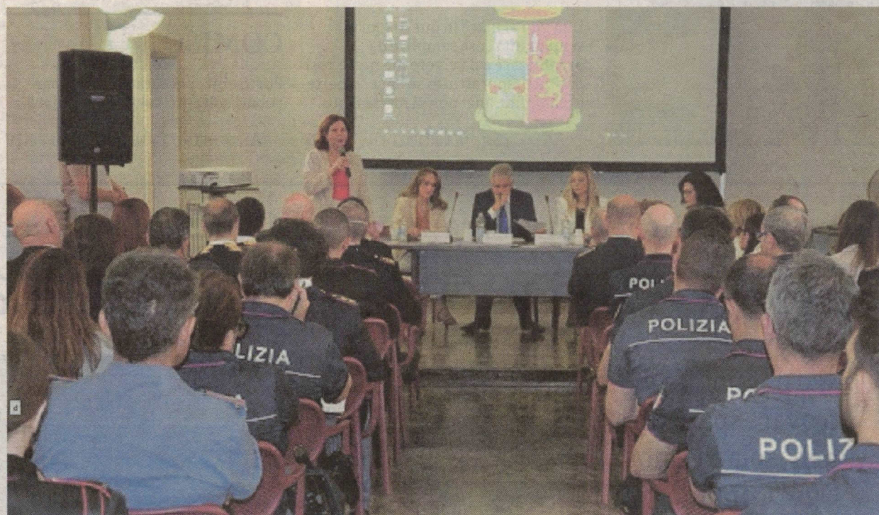
Un momento della conferenza organizzata dal questore di Ragusa, Giusy Agnello (nella foto a sinistra)