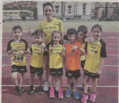
Enna: i talenti della Running Modica