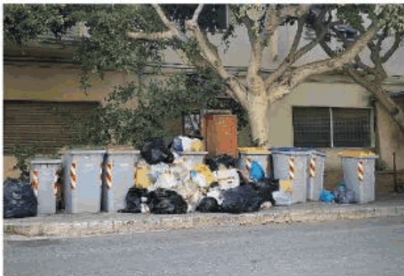
L'emergenza rifiuti resta al centro del dibattito