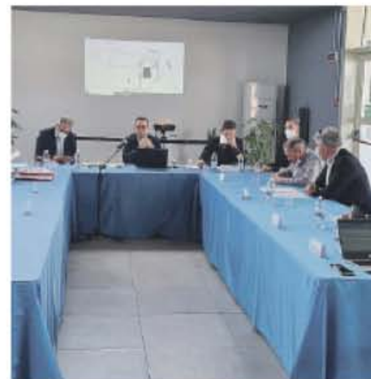
Confronto. La conferenza dei servizi promossa dal Libero consorzio e, nella foto a sinistra, una proiezione progettuale della stazione passeggeri.