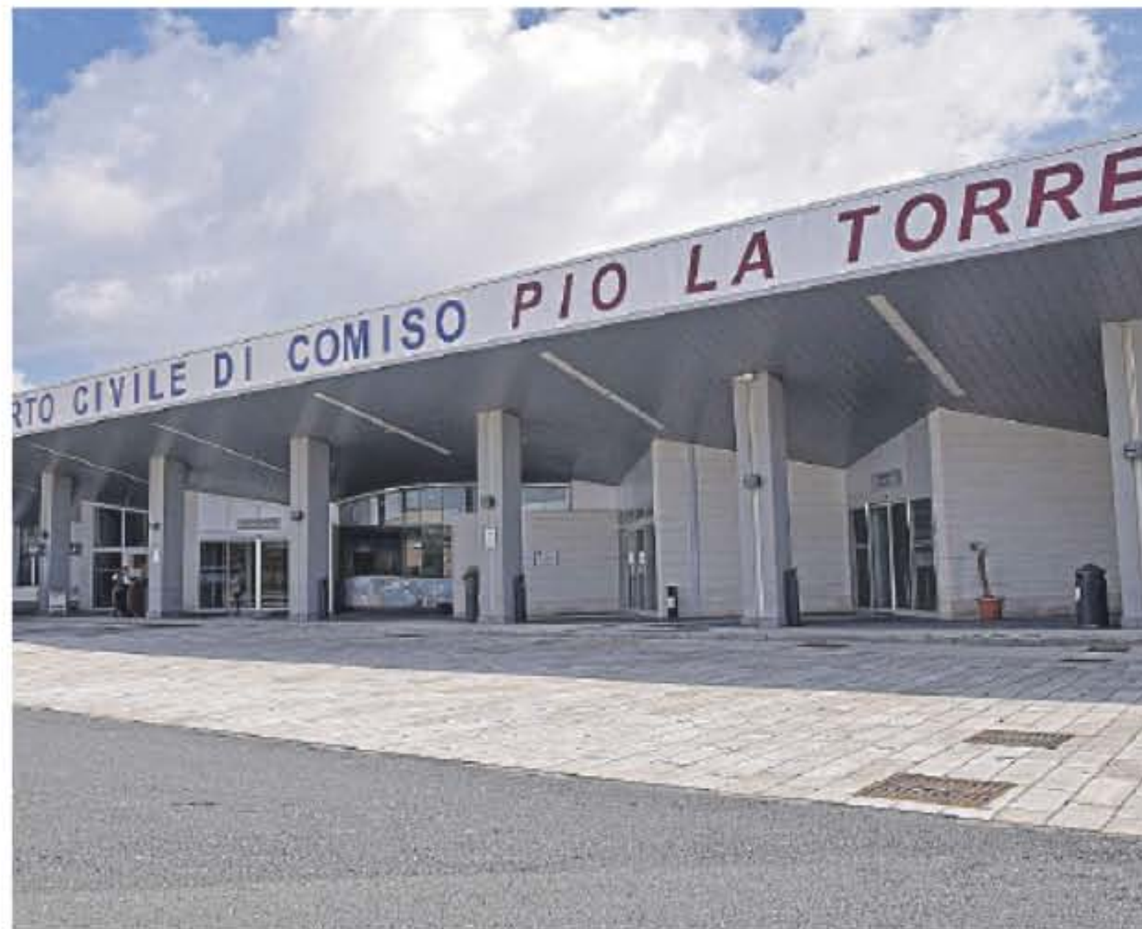
L'aeroporto, sopra l'Asca di Ispica e, nel riquadro, il consorzio di bonifica

Si è conclusa venerdì notte la maratona per l'approvazione della Finanziaria regionale 2022. Una manovra da 20 miliardi, arrivata in extremis, con gli uffici dell'Ars subito al lavoro con l'obiettivo di giungere alla pubblicazione in gazzetta ufficiale entro la fine della prossima settimana. Nel frattempo, diversi i commenti politici e gli sviluppi attesi per il territorio ragusano. L'on. e Orazio Ragusa ha ricordato "la grande difficoltà con cui deve fare i conti il bilancio regionale", parlando di un atto che punta alla solidarietà dato che non "sono venuti meno gli aiuti alle categorie fragili". Tra i prin-