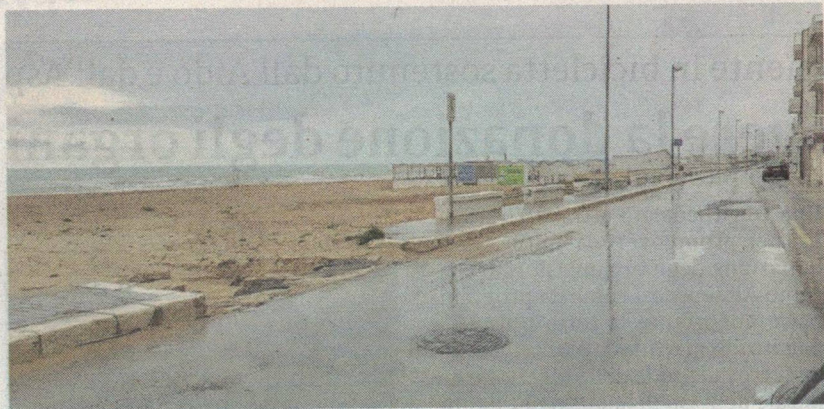
Le aree del lungomare interessate dai lavori

banistica e Manutenzioni. Premessa: "Nessun provvedimento è stato effettuato in risposta ai rilievi ai rilievi presentati l'anno scorso".