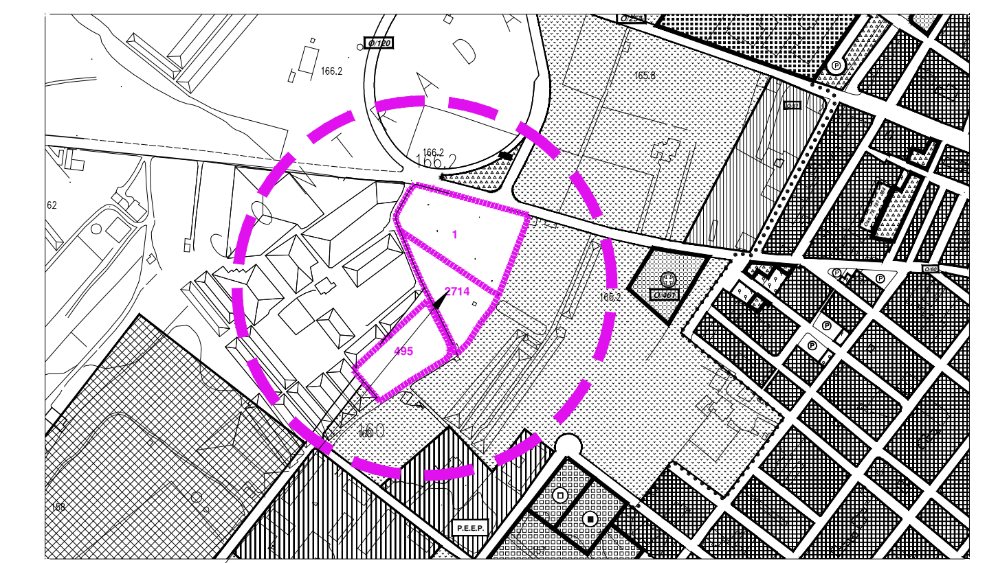
NUOVA DESTINAZIONE AREA IN VARIANTE ZONA "E" (F.104 PART.1-2714 E F.103 PART.495)