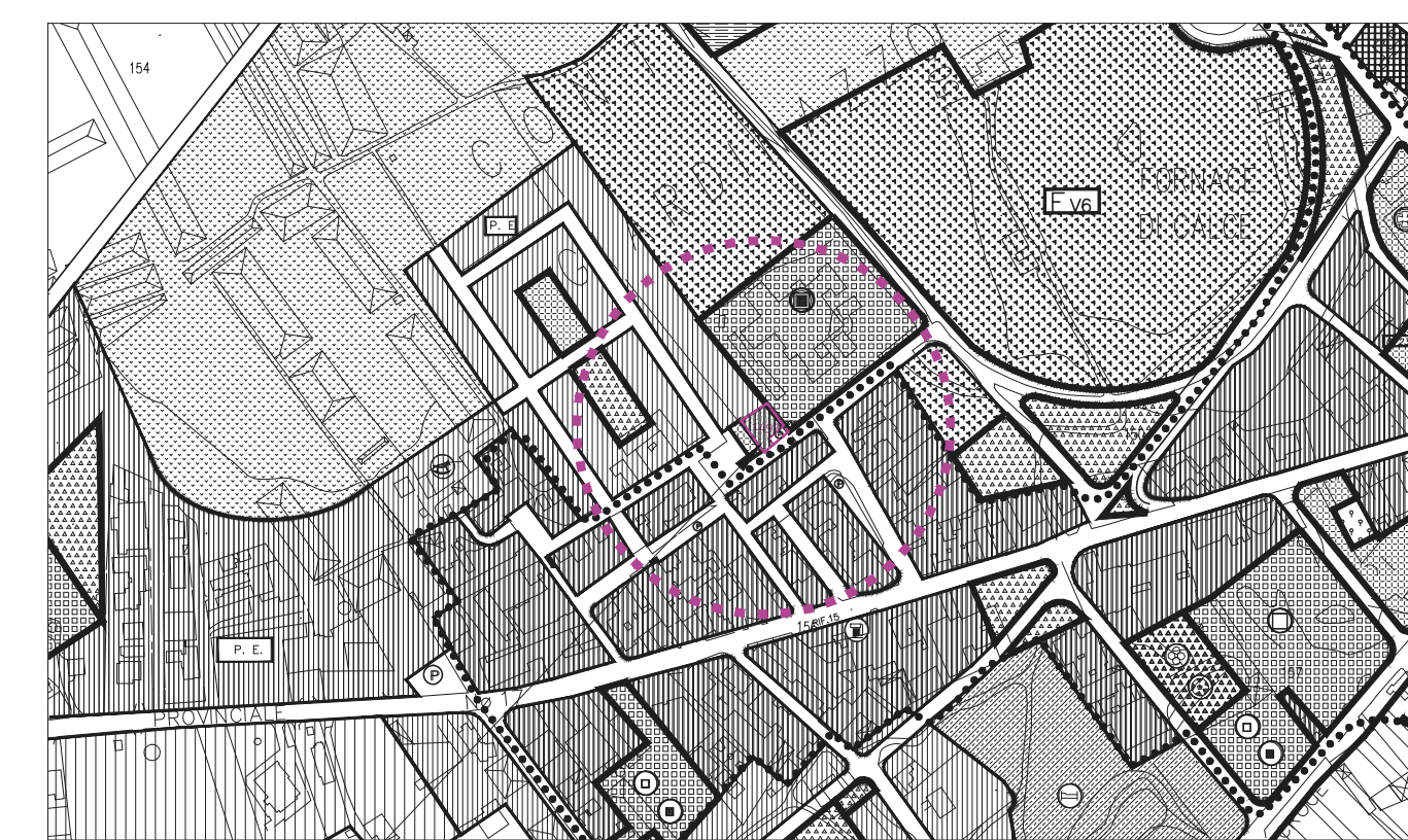
AREA OGGETTO DI VARIANTE NUOVA ZTO "B4*" (F.120 PART.1497)

Elaborati Redatti dalla D&C - ARCHITETTURA E INGEGNERIA S.R.L.