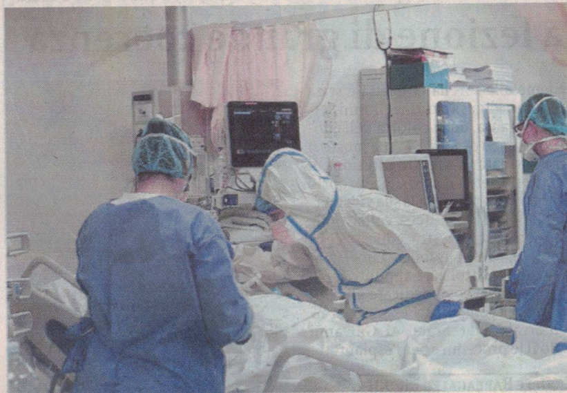
Ancora un decesso a causa del covid in provincia: è la vittima numero 511

Nella giornata di lunedì 28 marzo sono state 267 le somministrazioni di vaccino anti-Covid effettuate in provincia di Ragusa: 9 prime dosi, 47 richiami, 211 terze dosi e quarte dosi. A Ragusa, al centro vaccinale Asi, inoculate 36 dosi. Quattro i vaccini, 2 prime dosi e 2 richiami, somministrati agli under 12.