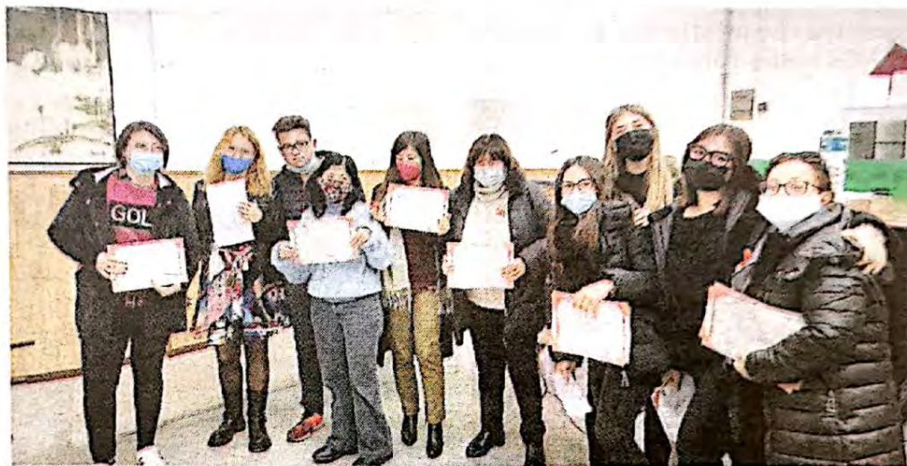
Due momenti dell'iniziativa che si è tenuta all'istituto Marconi di Vittoria