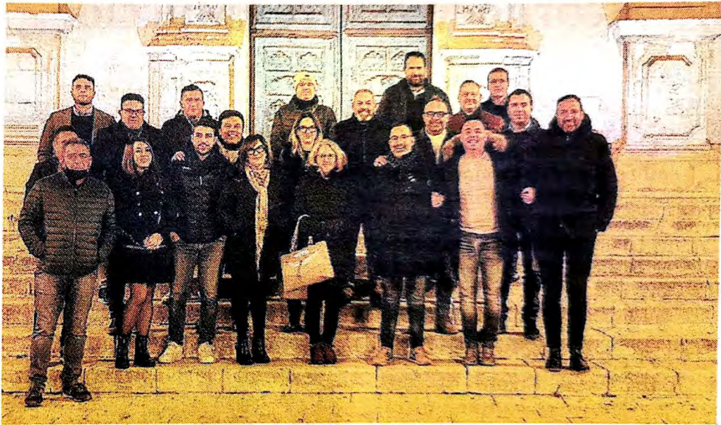
● I dirigenti del Movimento politico Sviluppo ibleo