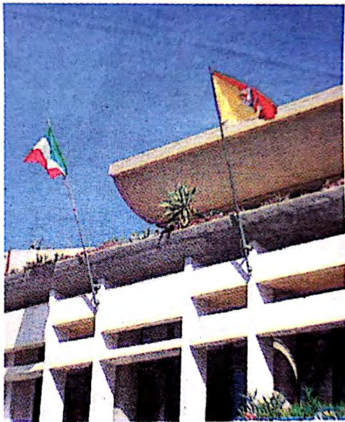
La sede della delegazione