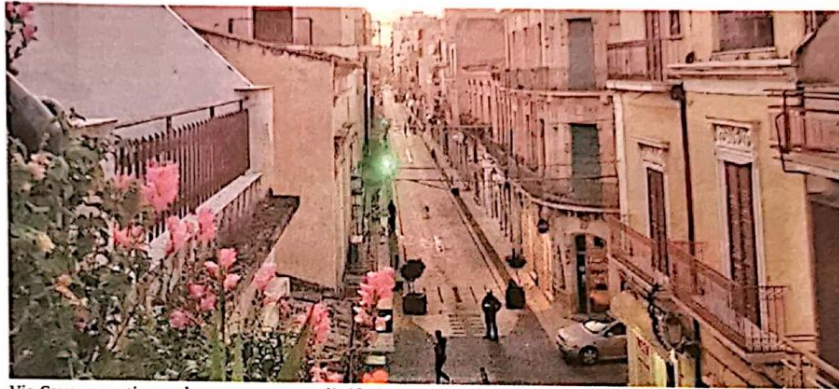
Via Cavour continua ad essere un punto di riferimento per gli operatori della ristorazione cittadina

«Dobbiamo creare le condizioni per evitare la fuga dei più giovani»