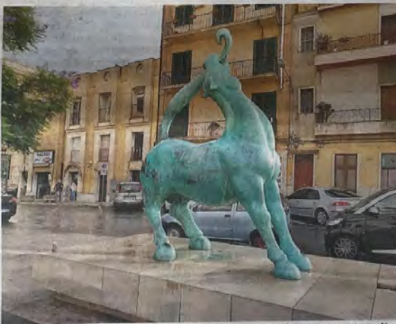
L'opera realizzata a Vittoria e, sopra, il Charging Bull di Arturo Di Modica

➔ L'autore della celebre statua Charging Bull simbolo della Borsa di New York è morto lo scorso febbraio, la città lo onorerà così