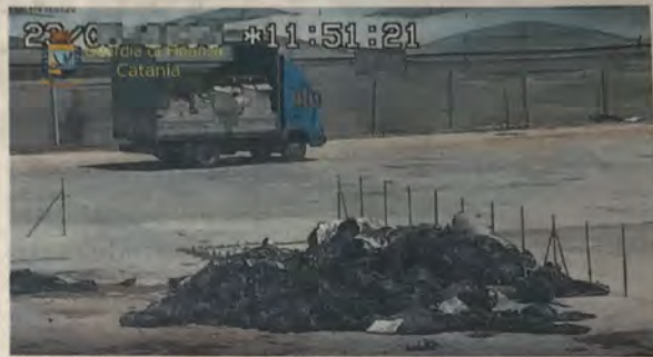
Alcune delle intercettazioni legate all'operazione Ghost trash