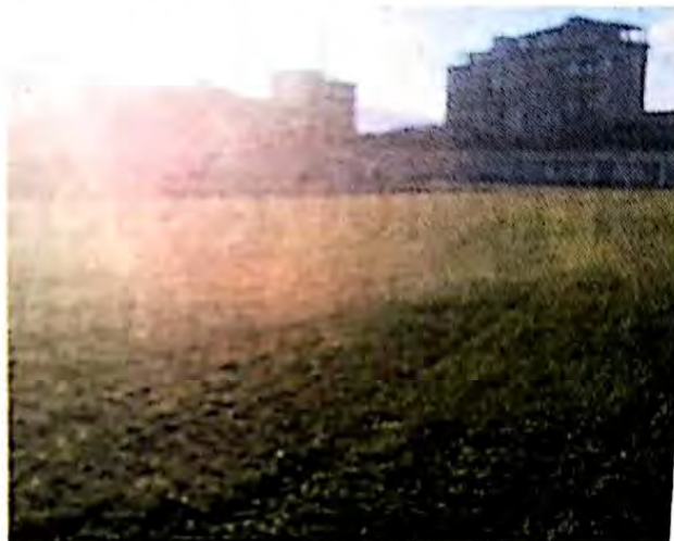
Il manto erboso dello stadio

La soluzione, e per molti tifosi sarà una buona notizia, risiede già nella prossima stagione. «Il Vittoria non molla - scrive in una nota il sodalizio biancorosso bloccato nel suo prima