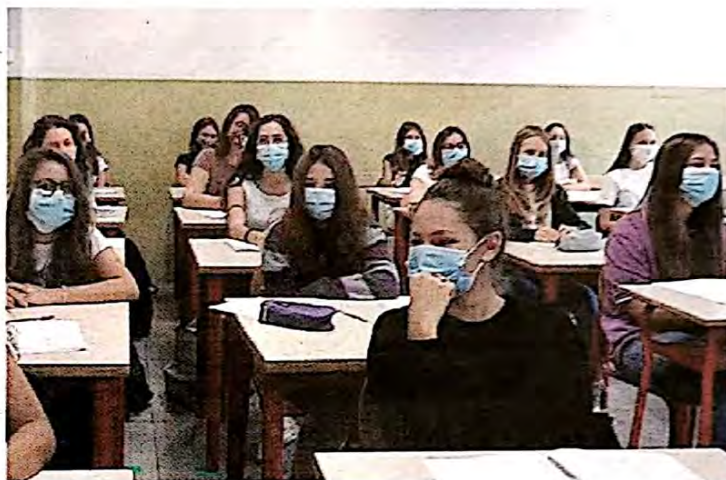
A scuola, anche in provincia di Ragusa, si sta con le mascherine e si rispettano le distanze. Ad Acate, sotto l'istituto Capitano Puglisi, lezioni ancora in Dad. Si riparte tra qualche giorno.