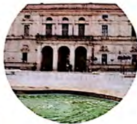
Il Comune di Ragusa ha già raccolto numerose istanze dopo poche ore l'apertura degli uffici.

Procedono a Ragusa le operazioni per la distribuzione dei buoni spesa avviata da Palazzo dell'Aquila. Giovedì mattina una quarantina le domande pervenute dopo poche ore l'apertura degli uffici. È possibile presentare l'istanza in modalità online accedendo all'apposito link nel sito istituzionale del Comune. Per ulteriori informazioni si potranno contattare, dal lunedì al venerdì, dalle ore 9 alle ore 12, i numeri telefonici: 0932676851, 0932676852, 0932676849, 0932676856, 0932676871.