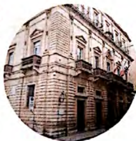
Al Comune di Vittoria le istanze potranno essere presentate entro e non oltre il prossimo 20 dicembre.