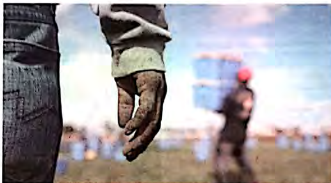
Il fenomeno del caporalato continua ad essere preoccupante a Vittoria

Nel 2016 è stata approvata la Legge 199/2016 che finalmente i-