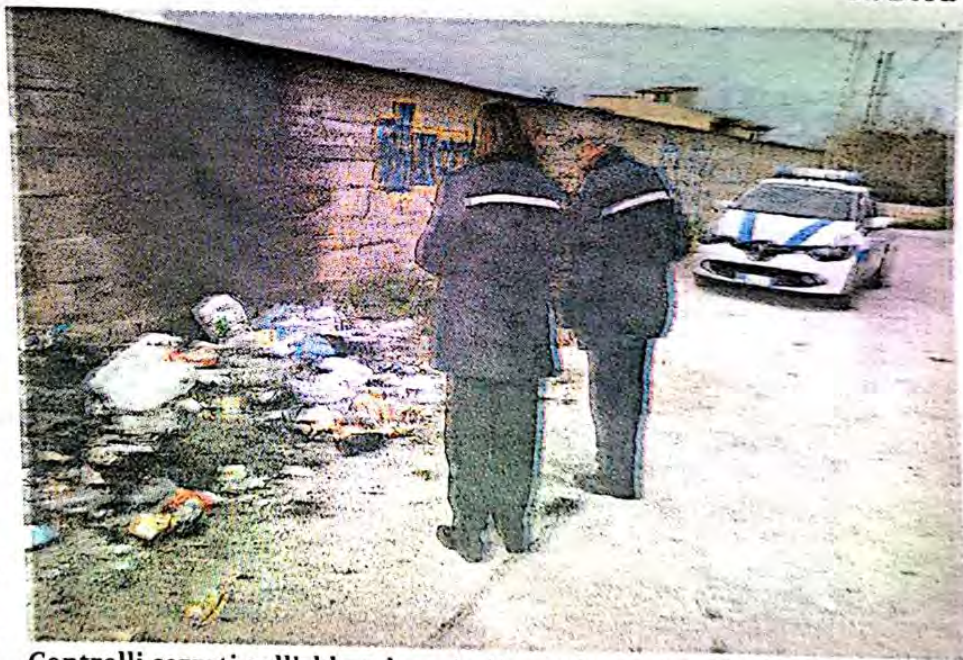
Controlli serrati sull'abbandono indiscriminato dei rifiuti