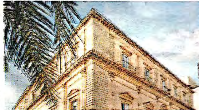
Palazzo Iacono dovrà ancora attendere i nuovi amministratori