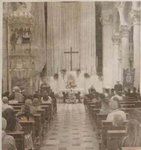
Chiesa piena, nel rispetto delle regole sul distanziamento