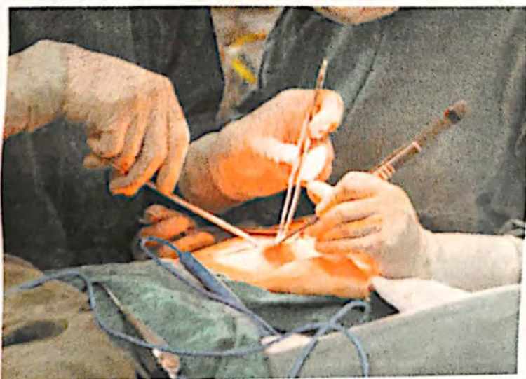
L'intervento di espianto degli organi è stato eseguito al Guzzardi

«A nome della direzione generale e della comunità - ha detto il direttore sanitario ospedaliero Drago - ringrazio i familiari della signora che hanno manifestato, sin da subito, la volontà alla donazione degli organi. Dimostrando la sensibilità e la generosità dei cittadini vittoriesi». La precedente donazione che ha coinvolto l'Asp di Ragusa si era registrata nell'aprile scorso. Donatrice una paziente di 41 anni, deceduta a Ragusa, la cui famiglia ha deciso di dare l'assenso per l'espianto degli organi. I polmoni hanno salvato la vita ad una ragazza palermitana. I reni, invece, sono stati trapiantati a due pazienti a Palermo e Catania. Il fegato ha salvato un bambino di Roma ed un altro paziente in attesa a Palermo.