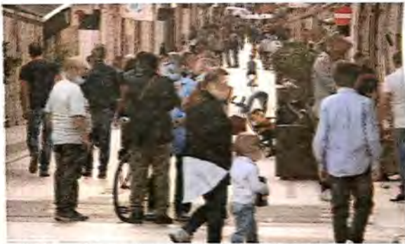
La Via Cavour è tuttora interdetta al transito delle biciclette