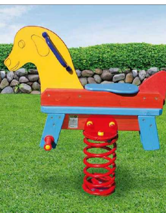
Cavalluccio a molla