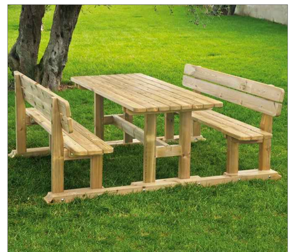
Tavolo e seduta da Pic Nic