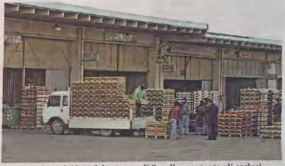
L'assegnazione dei box del mercato di Fanello scontenta gli esclusi

Andiamo alla seconda graduatoria, quella dei 23 commercianti. Di questi, sempre in via provvisoria, sono stati esclusi 4 richiedenti, che potranno ovviamente esercitare il loro diritto al ricorso al Tar. Nulla da eccepire, infine, per la graduatoria delle cooperative, i 3 partecipanti sono stati tutti ammessi. I motivì dell'esclusione, come detto, non riguardano il casellario giudiziale ma incongruenze di tipo amministrativo: presunte pendenze fiscali o contributive che non hanno