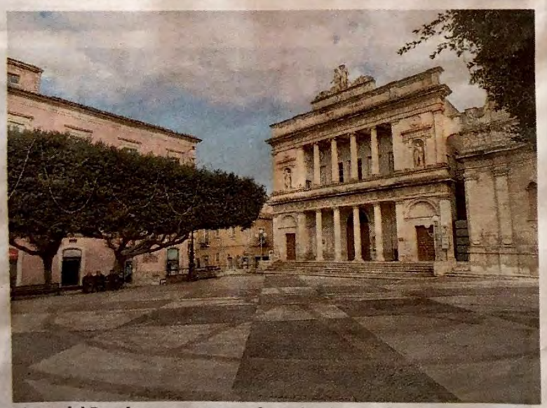
Piazza del Popolo e, sopra, una volante in piazza Calvario

Nei prossimi giorni il minorenne comparirà davanti al giudice del Tribunale di Catania che ha emesso il provvedimento cautelare alla presenza del difensore. In quella occasione potrà difendersi dalle accuse mosse e toccherà al giudice decidere in merito.