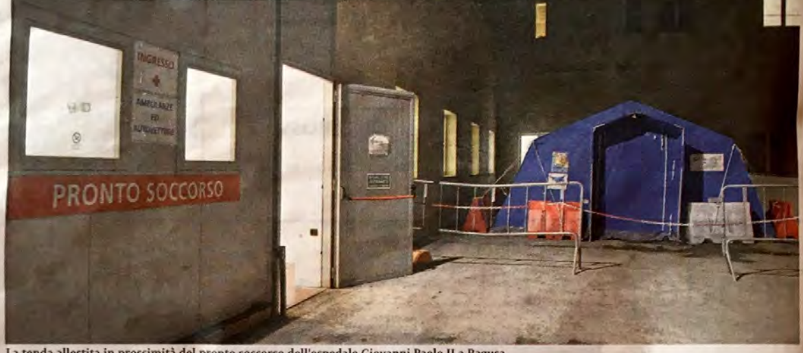
La tenda allestita in prossimità del pronto soccorso dell'ospedale Giovanni Paolo II a Ragusa

Tende dunque all'ospedale Giovanni Paolo II di Ragusa, al Guzzardi di Vittoria e al Maggiore di Modica. Così come disposto dalle linee guida ministeriali, l'Asp ribadisce che in caso di sintomi riconducibili al coronavirus occorre sempre contattare il medico di famiglia o telefonare ai numeri 112 o 1500 e non recarsi direttamente in ospedale al pronto soccorso. In provincia di Ragusa sono aumentati i casi di quarantena volontaria da parte di alcune persone arrivate dal Nord Italia, mentre restano al centro sportivo del-