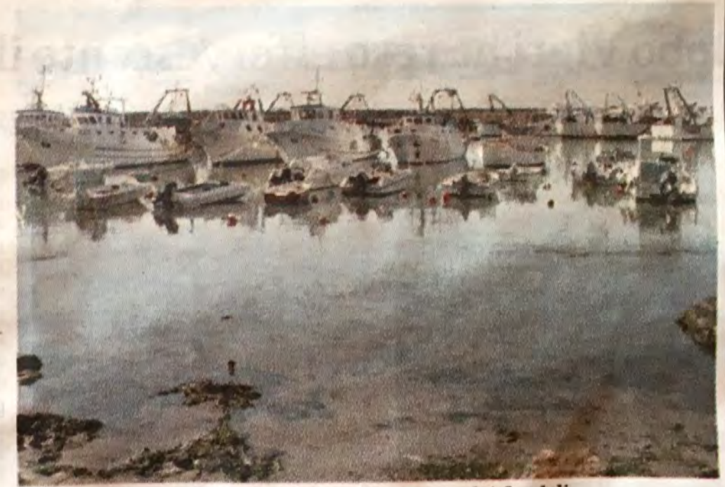
Il porto di Scoglitti è a rischio insabbiamento dei fondali