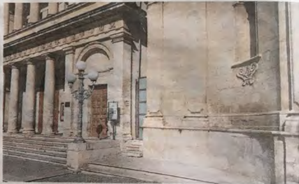
● I prospetti ripuliti della chiesa e del teatro