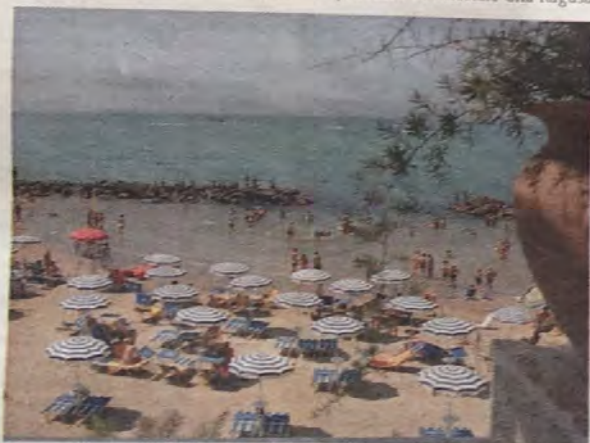
L'accoglienza ai turisti deve essere studiata con attenzione secondo la Cna