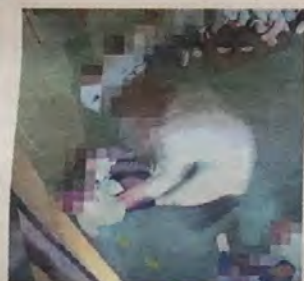
I maltrattamenti ripresi dalle telecamere. In alto, la fase dell'arresto

Obiettivo del collegio difensivo è la revoca della misura cautelare