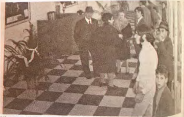
L'inaugurazione del cinema Golden cinquant'anni fa