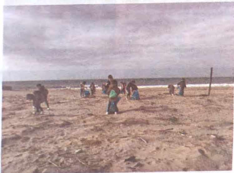
La raccolta dei rifiuti in spiaggia

«Nel nostro piccolo tentiamo attraverso la pratica del buon esempio del fare, di fornire il nostro contributo e lo abbiamo fatto insieme ai ragazzi delle scuole che sono i cittadini del futuro si quali abbiamo il dovere di dare strumenti cognitivi e pratici e di metterli nelle condizioni di non perdersi, con indifferenza, i nostri stessi errori. E' tempo infatti di scelte ed azioni collettive, il Mare e La spiaggia hanno bisogno di umanità». Nella giornata gli ambientalisti coadiuvati dai ragazzi dopo avere raccolto i rifiuti hanno fatto un censimento per distinguere quelli biodegradabili dagli altri. Una selezione interessante. ●