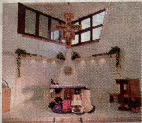
L'interno della chiesa

“Esprimiamo - dichiarano i commissari straordinari - tutta la nostra vicinanza alla comunità cristiana vittoriese per il vile atto sacrilego. Non è la prima volta che la parrocchia subisce furti: qualche giorno fa erano stati rubati paramenti sacri e adesso i ladri hanno mirato direttamente al tabernacolo con le ostie consacrate”. La Commissione, dopo aver condannato fortemente il furto, ha aggiunto: “A