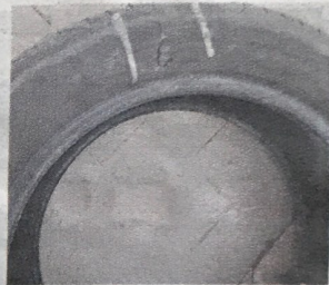
Pneumatici rovinati dalle buche

se metti la gomma nuova il prezzo oscilla dai 60 agli 80 euro, a seconda del tipo di pneumatico che monti. Se è vero che i gommisti di Vittoria sono all'incirca una decina, e se consideriamo che in questo periodo di gran lavoro (tenuto conto che le piogge abbondanti non danno tempo per la riparazione delle strade scassate) facendo la media di 10 "vittime" a gommista, moltiplicati per 10, dovrebbero essere 100 i vittoriosi che ogni giorno escono di casa e al mattino trovano la ruota