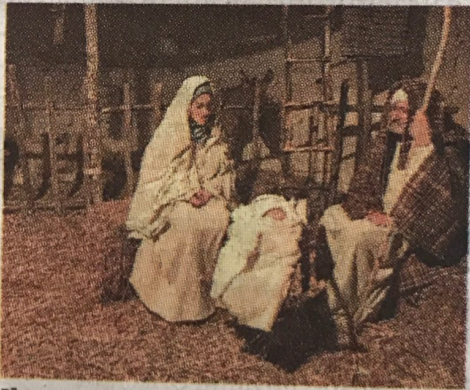
Il presepe dello scorso anno

Dal 25 dicembre prenderanno il via le rappresentazioni negli spazi retrostanti la chiesa