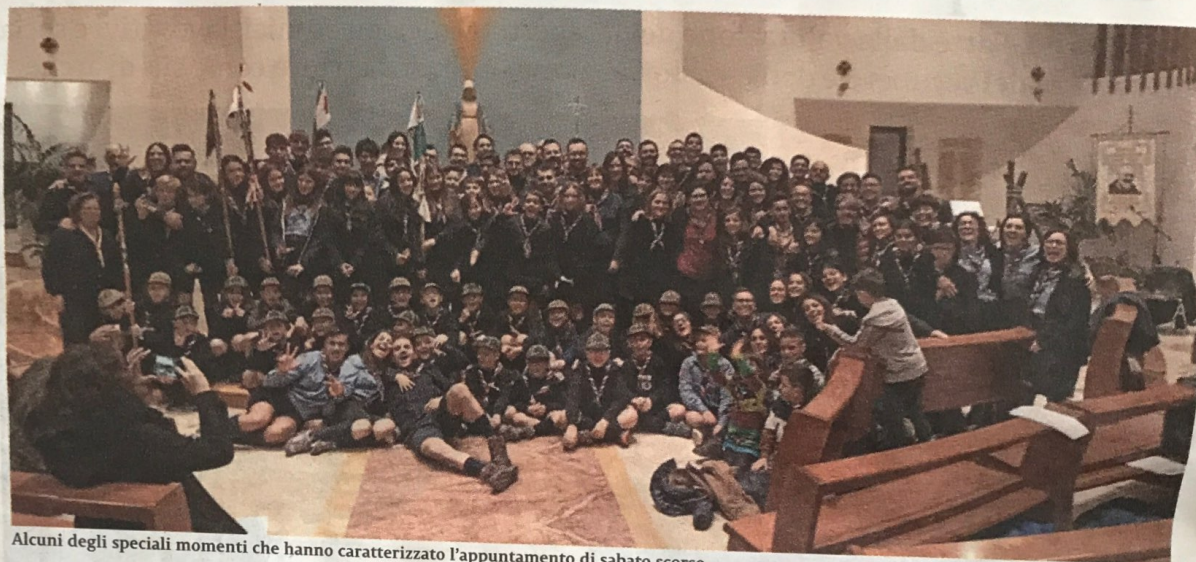
Alcuni degli speciali momenti che hanno caratterizzato l'appuntamento di sabato scorso

Le celebrazioni hanno preso il via sabato scorso, 14 dicembre, alle 20, nella chiesa Resurrezione, dove ha sede il gruppo scout, ed hanno registrato la partecipazione dei ragazzi con le loro famiglie, dei capi in servizio e di tanti altri "ex" scout che hanno vissuto l'esperienza in gruppo negli anni passati. Fondato l'11 dicembre del 1989 in una zona di periferia, vicino al Mercato dei Fiori di Vittoria, il gruppo ha mosso i suoi primi passi inserendosi nel tessuto sociale ed ecclesiale della parrocchia Resurrezione, da poco istituita, vivendo - di pari passo con la stessa - le prime esperienze educative e di evangelizzazione del territorio allora ancora in piena espansione. Trent'anni di storie, volti, esperienze, che hanno caratterizzato la storia del