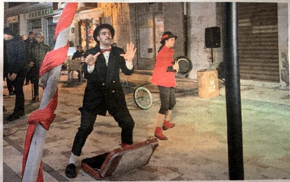
Un momento della Notte bianca tenutasi ieri in centro storico