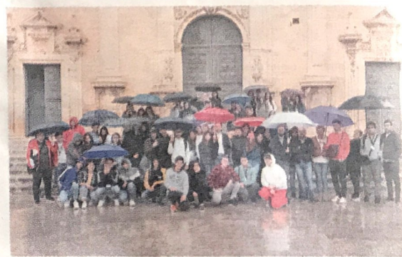
● Gli studenti che hanno partecipato alla visita guidata

diffusa, tale obiettivo possa sembrare di secondaria importanza ai più, ma la realtà è ben diversa" precisano i componenti di "Viva" ringraziando "per avere come alleati nell'importante mission la dirigente scolastica, Rosaria Costanzo e tutta la comunità di docenti del Fermi. "Seguendo l'esempio di grandi città economicamente e culturalmente più competitive, con lungimiranza consentono agli studenti di vivere pienamente delle preziosissime esperienze di confronto con realtà diverse dalla loro" concludono auspicando prossime e feconde collaborazioni con il Fermi.