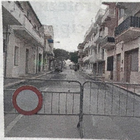
Via Plebiscito chiusa al traffico