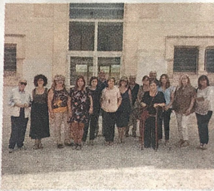
Gli artisti che espongono