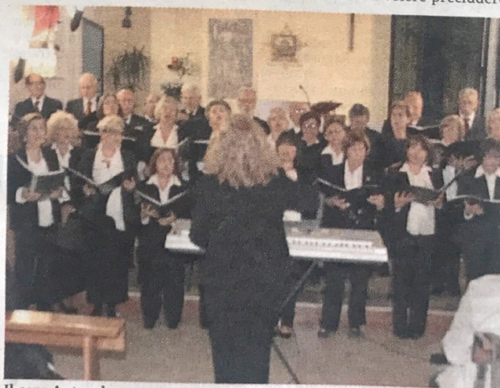
Il coro Antea durante un paio di esibizioni degli ultimi anni