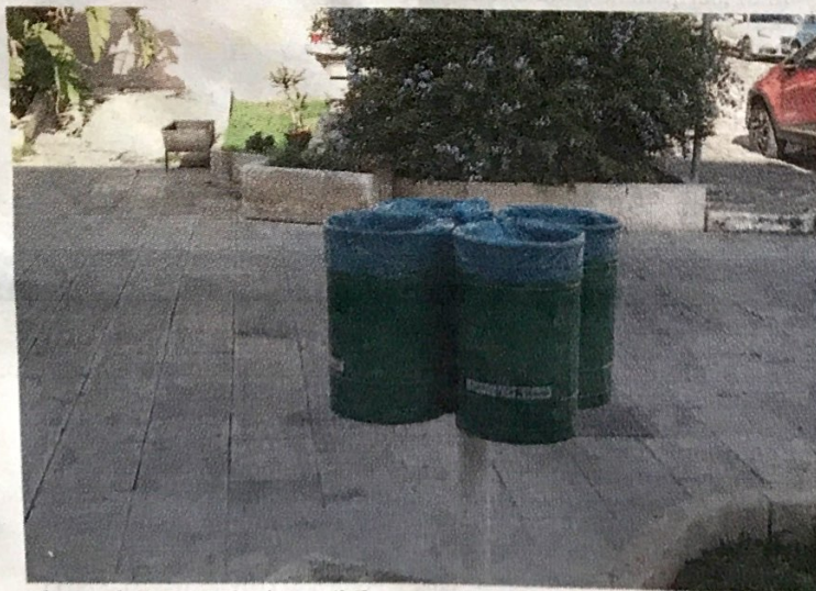
Alcune delle foto che è possibile trovare sulla pagina Facebook

Dalla pagina social della direzione Ambiente e Territorio spuntano, curatamente documentate da materiale fotografico, varie azioni di pulizia da quelle indirizzate alla zona industriale di via Marangio a quella costeggia e conduce alla struttura mercatale di contrada Fanello, inoltrando anche le vie Virgilio Lavare, delle Querce, Giardina (quella porta dentro la meravigliosa Valle dell'Ippari) sino ai vari ingressi cittadini. Insieme alle immagini di ritrovata pulizia per alcuni luoghi cittadini appaiono anche quelle di "ammorzione" in cui vengono documentate modalità con le quali vengono scovate gli sporcaccioni (dalle telecamere montate agli indizi scovati tra i rifiuti). Con la volontà di fare anche un servizio informativo, la pagina Facebook della direzione Ambiente e Territorio fornisce consigli utili su come differenziare e una spiegazione sul perché compare talvolta il bollino di rifiuto "non conforme". "Rappresenta non un'ammonizione, bensì un'opportunità in quanto si concede al cittadino la possibilità di andare a ri-differenziare i propri rifiuti" scrivono nella pagina ricordando che i sacchetti non differenziati debbono essere semitrasparenti per tutti i tipi di rifiuti e biodegradabili per l'umido.