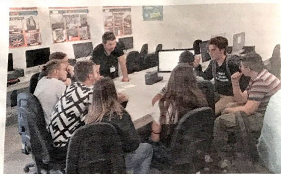
Un gruppo di studenti durante una sessione di attività al Fermi