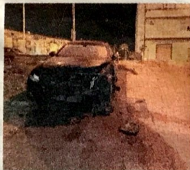
Nelle foto di Fabio Baglieri, le auto incendiate in via Cavalieri di Vittorio Veneto

Altre due auto in fiamme. Continua la scia di fuoco in città. Adesso la tensione sale in città e le forze dell'ordine stanno indagando per vederci chiaro. In campo gli agenti della squadra mobile della polizia di Ragusa diretti dal vicequestore Antonino Ciavola che operano in sinergia con i colleghi del commissariato di polizia di Vittoria, i primi ad arrivare sul luogo teatro dell'incendio. Le fiamme sono quasi sicuramente di origine dolosa sicché si sta indagando a fondo. I roghi, quindi, non sono frutto del caso, an-