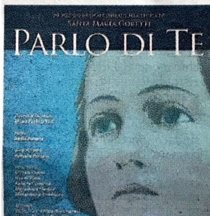
La locandina del recital