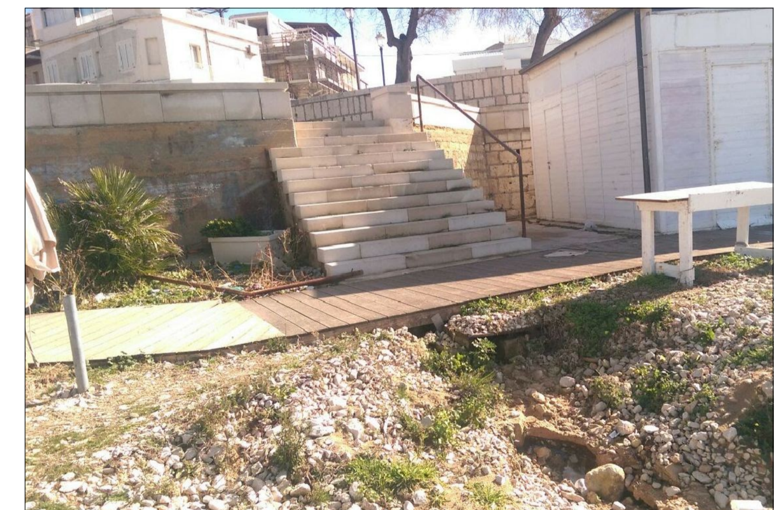
FOTO 3 _AREA DI INTERVENTO