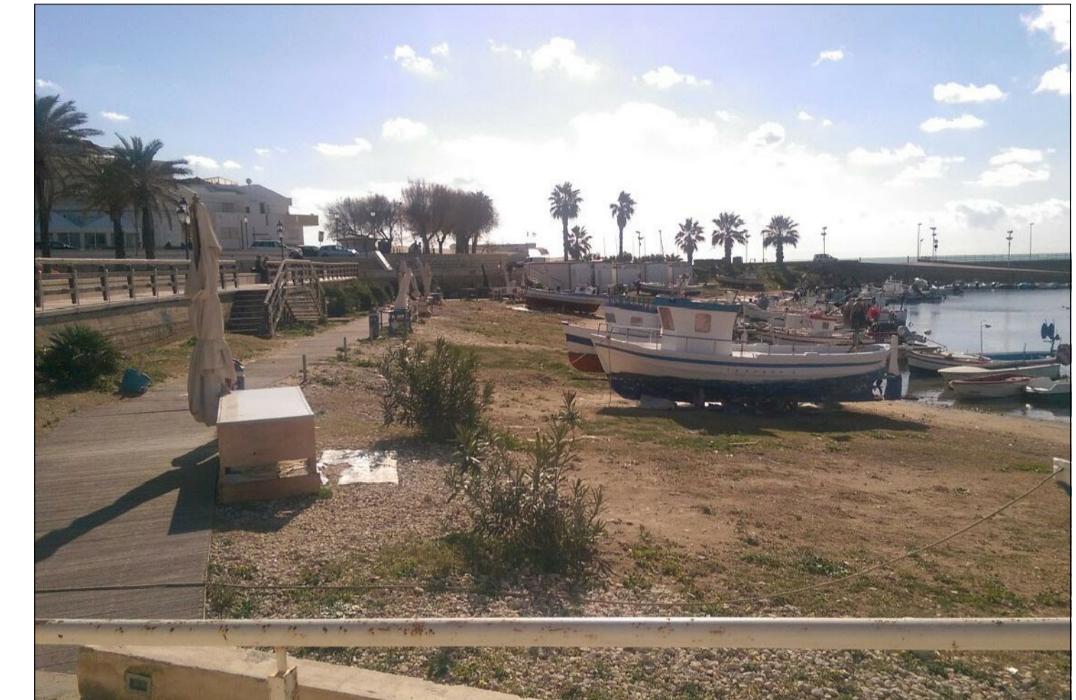
FOTO 2 _AREA DI INTERVENTO