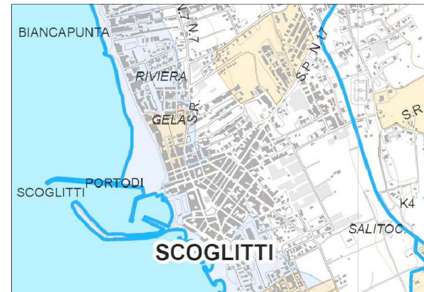
CARTA DEI BENI PAESAGGISTICI- SCALA 1/10000