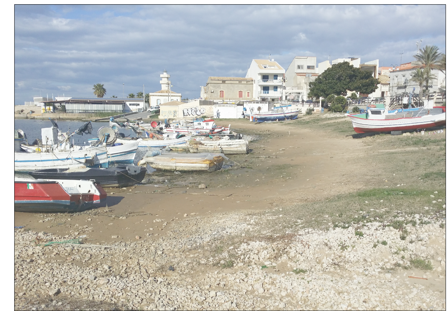
FOTO 1 _AREA DI INTERVENTO