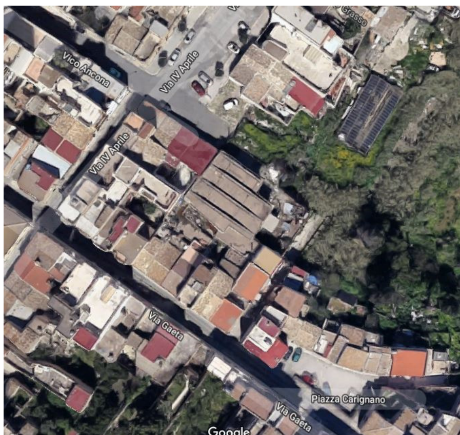
Veduta aerea della zona

L'opera ammodernata alla fine degli anni ottanta dello scorso secolo, non fu mai utilizzata ed è rimasta in disuso, e lo è ancora, da circa trent'anni. I locali presenti, utilizzati saltuariamente come magazzino e/o deposito comunale, risultano in pessimo stato di conservazione, mentre le strutture portanti sono in discrete condizioni, sia dal punto di vista conservativo che statico-strutturale. La condizione del manufatto, di fatto giustifica la scelta di un intervento di recupero funzionale e di riuso di un vecchio immobile di proprietà pubblica, nonché l'adeguamento dei locali alla nuova destinazione d'uso ossia di " Luogo di aggregazione giovanile ".