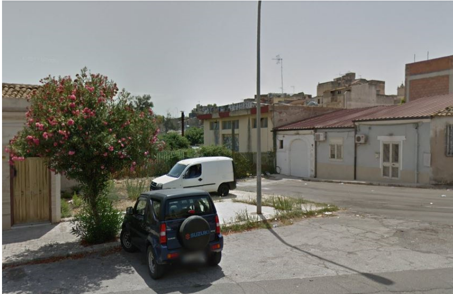
Veduta della zona d'intervento dalla Via IV Aprile angolo Via Ancona

L'immobile, realizzato su uno spazio di circa mq 700, ha una superficie coperta di circa mq 450, ricade in Zona "F3" del vigente PRG, destinata ad "Attrezzature pubbliche di interesse urbano" , posta all'interno della Z.T.O. denominata "A" e normata dalle N.T.A. contenute in seno allo strumento urbanistico.