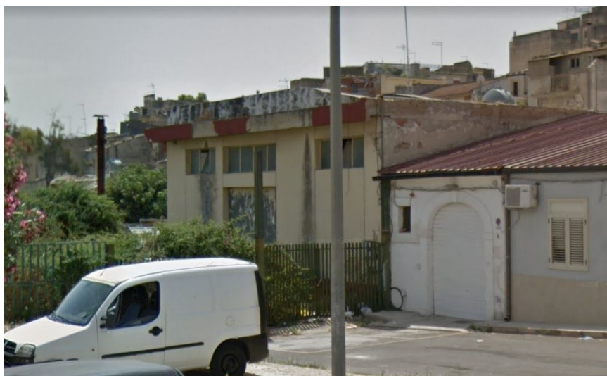
Veduta dell'edificio dalla Via Ancona

L'intervento in progetto prevede la manutenzione straordinaria e conservativa di quanto esistente, nonché le modifiche interne necessarie all'adeguamento funzionale legato alla futura destinazione di "Luogo di Aggregazione Giovanile con Attività di Animazione Sociale e Partecipazione Collettiva per la Cultura, connesso alle Attività Musicali" .