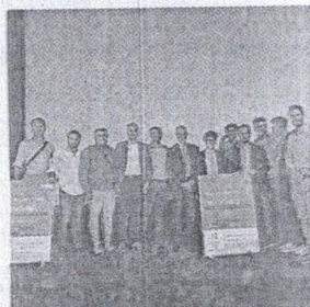
L'associazione con Cottarelli

Sogniamo una Vittoria radicalmente diversa, che guardi al futuro. Questo il titolo di una nota diffusa dall'associazione "èVviva" all'indomani della manifestazione che ha visto in città il professore Carlo Cottarelli, economista di fama internazionale. "Quando siamo nati avevamo tanta voglia di fare e in questi mesi di duro lavoro abbiamo cercato di concretizzare le nostre idee. Nelle ore di lavoro trascorse tra la gente - affermano i soci di èVviva - ci siamo resi conto che la città di Vittoria è come una creatura indifesa e bistrattata. Constatata questa triste realtà, è sorta in noi, giorno dopo giorno, la convinzione che è dovere della collettività "resistere, resistere e resistere" dando vita ad una inversione di tendenza che alimenti la fiamma della