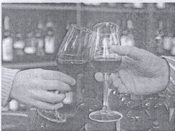
L'esaltazione del vino diventa la priorità di MedInWine

Un'occasione di rilancio economico e turistico di una città recentemente passata alla cronaca per fatti luttuosi e tragici di cui sono infarcite le sue recenti storie nere. Un cambio pagina alla ricerca anche di un registro diverso