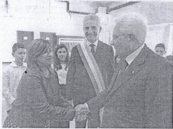
L'incontro tra Mercante e Mattarella sotto lo sguardo di Dispenza

Così dopo Napoli, Sondrio, Taranto, Isola d'Elba per l'anno scolastico 2019-2020, è stata la scuola “Mariela Ventre” de L'Aquila ad ospitare la cerimonia nella quale ha fatto la sua comparsa pubblica il neo ministro Fioravanti portando il suo messaggio di saluto e di augurio agli studenti e agli operatori scolastici della Nazione e cogliendo l'occasione per presentare la progettualità del nuovo Governo per una migliore qualità della scuola italiana. ●