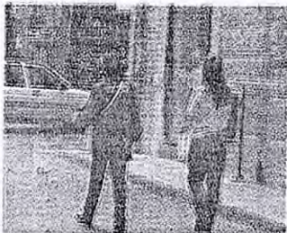
Potenziato il corpo dei vigili

«La sicurezza e la vivibilità della città sono un'assunzione di responsabilità della Commissione»