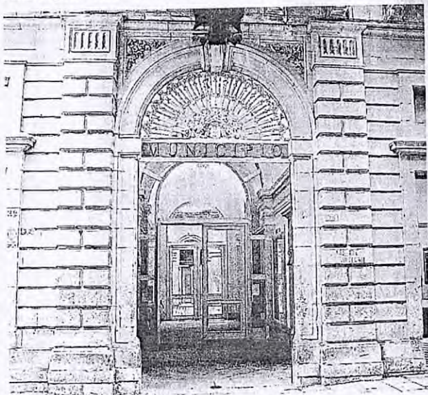
Vittoria. L'ingresso del palazzo municipale