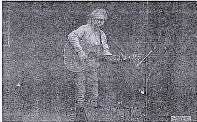
● Il cantautore Aldo Raffaele chiede un deciso cambio di rotta

pegnarsi per renderla migliore. I ragazzi hanno da sempre tra i loro punti di forza la capacità di sognare, di immaginare un futuro migliore e la passione per realizzarlo, incontrarli, pertanto, prima di una qualsiasi pianificazione culturale, diventerebbe a mio avviso un momento importante e coinvolgente. Oggi più che mai la nostra città deve puntare sulle nuove generazioni. Nessun cambiamento è realizzabile senza il loro contributo. Il paese ha bisogno di politiche coraggiose e obiettivi ben definiti, perché le radici del nostro futuro stanno nel presente”.