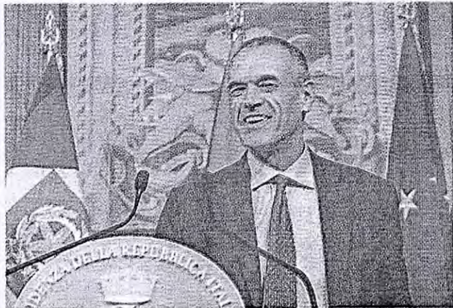
Carlo Cottarelli sarà il 12 settembre in città

Il dott. Carlo Cottarelli, noto ai più per l'incarico di governo conferitogli in seguito alla fase di stallo dopo le elezioni dello scorso 4 marzo 2018 (che accettò con riserva e poi, superato lo stallo, rimise nelle mani del presidente della Repubblica con grande spirito di dedizione e servizio), è sicuramente una delle menti più brillanti nel panorama italiano. Direttore dell'osservatorio dei conti pubblici italiani