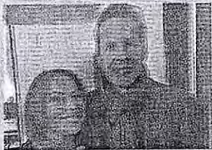
Maria Romano con Baglioni

Dalla Cortellesi a Marco Bocci, da Boldi ad Argentero, questi alcuni dei numerosi e "famosi attori" che saranno presenti al festival nazionale del cinema e della televisione che è il primo ed unico evento in Italia ad unire, in una sola manifestazione, il mondo del piccolo e grande schermo, attraverso eventi, incontri, interviste, proiezioni, spettacoli, concerti e dibattiti, aperti al pubblico. L'evento, realiz-