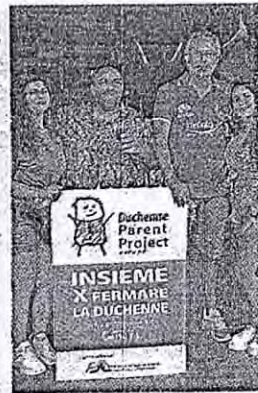
Il taglio del traguardo e sotto primo e terzo classificato. Sopra a destra 150 gli iscritti alla podistica le famiglie e i volontari di Parent Project che nei loro gazebo realizzati per l'occasione, hanno divulgato materiale informativo sulla patologia e distribuito gadget per tutti

Sono 150 gli iscritti alla podistica, che da un decennio anima la frazione