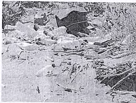
Le condizioni della spiaggia della Lanterna nel dossier fotografico di Fare Verde