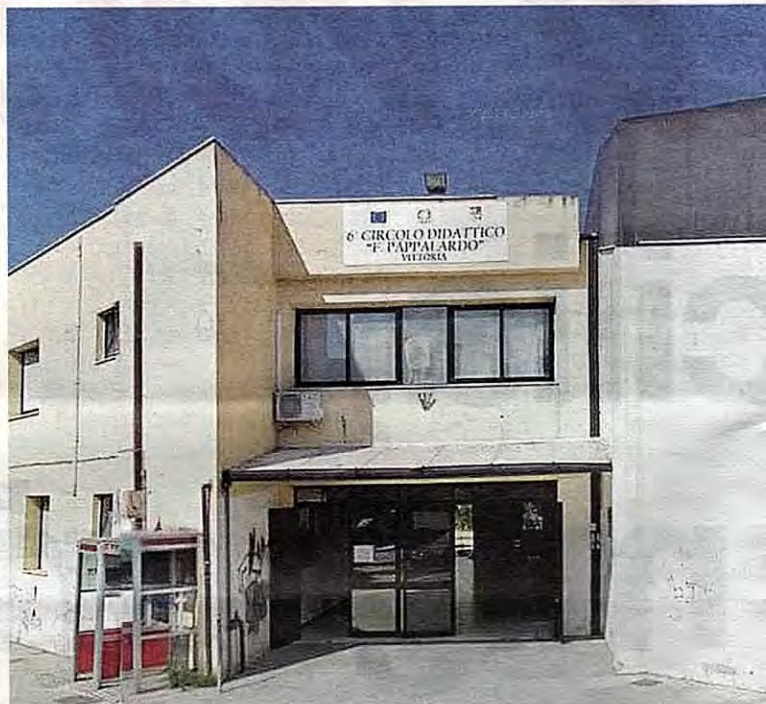
Scuole. L'istituto Pappalardo, dove si sono verificati cedimenti strutturali

per l'acquisto di nuove panchine, per la manutenzione delle panchine esistenti, delle scale di accesso alle spiagge, dei bastioni e delle ringhiere in legno; è prevista la piantumazione di alberi e l'acquisto di attrezzature ludiche a Cammarano». Altri interventi riguarderanno Vittoria. «Stiamo anche verificando la possibilità di piantumare nuovi alberi alla villa comunale grazie alla previsione di un nuovo capitolo dedicato al verde pubblico nel bilancio 2019/2021 già approvato» (FC*)