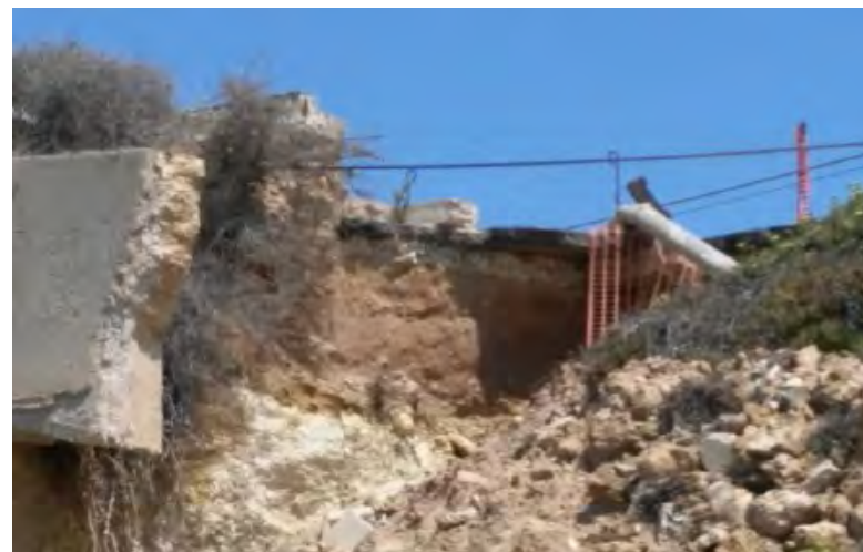
IL CROLLO DEL MANTO STRADALE DELL'ARTERIA CHE PORTA ALLA SPIAGGIA

Al danno causato dalla natura e dall'incuria dell'uomo si aggiunge anche l'attività svolta da privati durante le