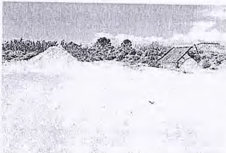
La cava per il prelievo di sabbia rinvenuta all'interno della discarica per inerti