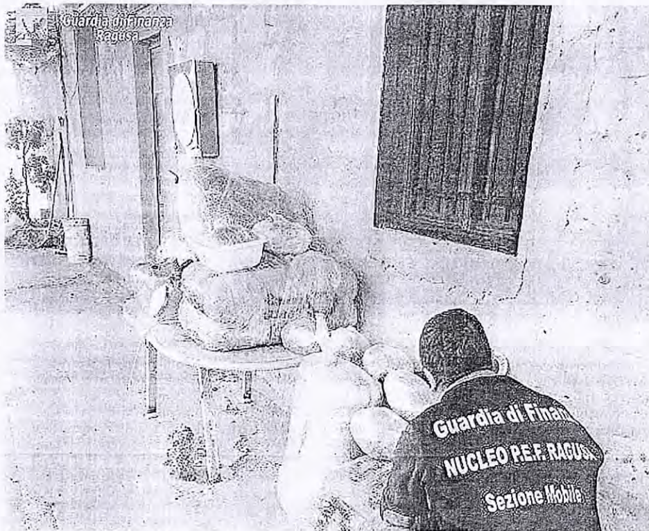
Maxisequestro di droga. I finanzieri esaminano i «pacchi» trovati nel casolare

La droga è sequestrata: il valore commerciale è di almeno mezzo mi-