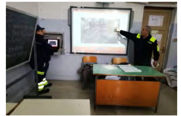
Sopra e in basso due momenti dell'incontro tenuto dai volontari della Protezione civile con gli alunni della «Vittoria Colonna»

portantissima, poi, la raccolta differenziata: molte delle cose che usiamo tutti i giorni sono fatte con materiali preziosi ed esauribili, oppure molto inquinanti. La carta ad esempio, o il vetro, possono essere rilavorati all'infinito, evitando così di tagliare alberi o di usare processi di lavoro che inquinano e surriscaldano la nostra Terra. Indispensabile anche evitare assolutamente di gettare i rifiuti ovunque, persino nelle nostre spiagge. Mangiando cibo locale o proveniente dalle città vicine non solo miglioriamo la nostra salute, dato che il cibo è più fresco ed ha meno conservanti, ma percorrendo