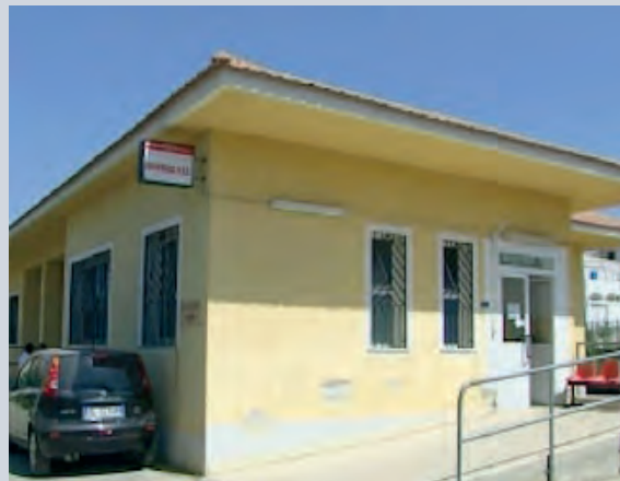
La sede del Pte di Scoglitti che, al momento, resta chiuso