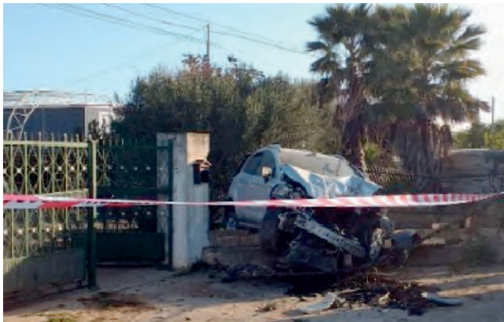
Le due auto che si sono ribaltate finendo fuori strada nell'incidente di ieri mattina sulla Vittoria-Scoglitti