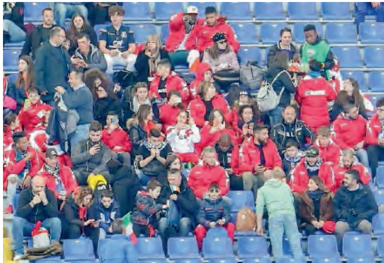
IL GRUPPO DELL'ISTITUTO COMPRESIVO SAN BIAGIO ALL'OLIMPICO DI ROMA