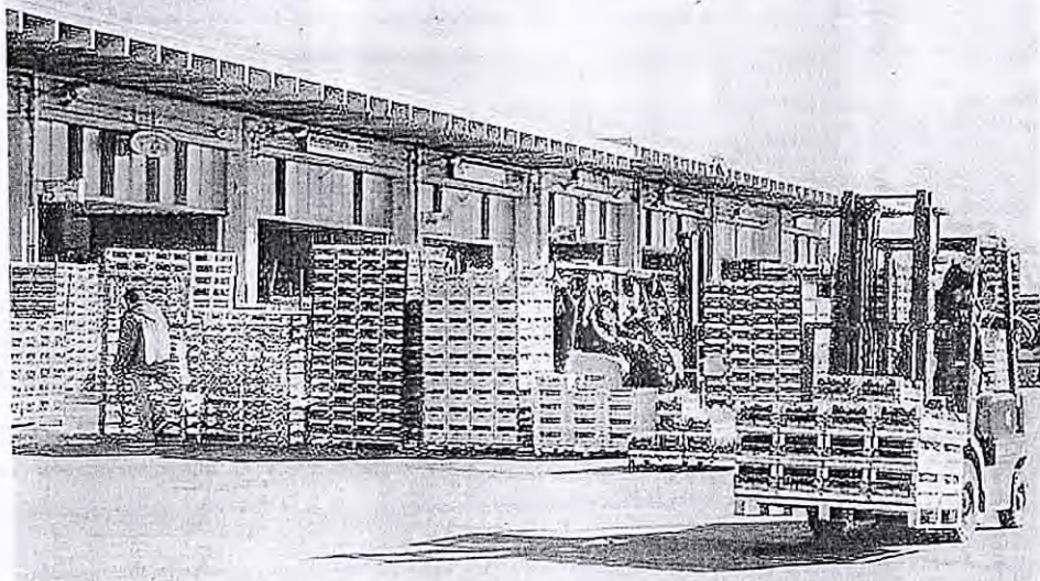
Commercio. Il piazzale del mercato ortofrutticolo di via Incardona