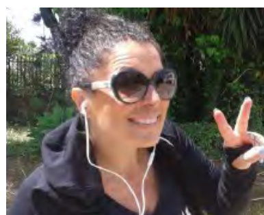
SCIVOLETTO STAKANOVISTA DELLA CORSA