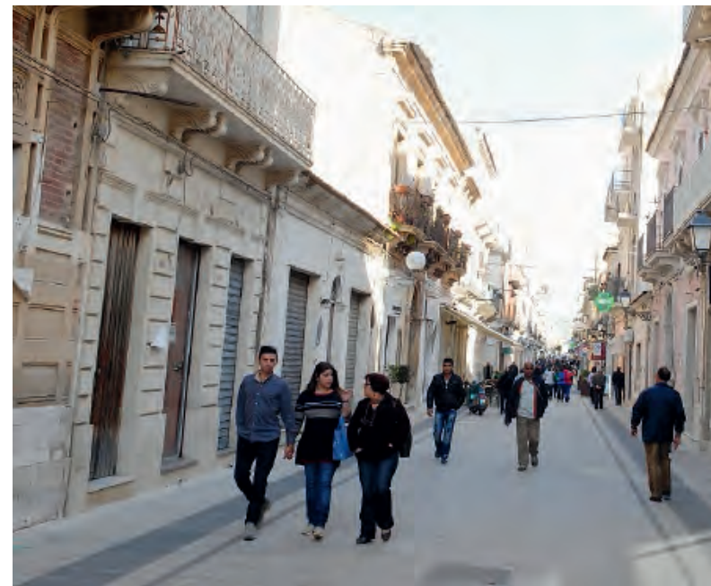
PER I PUBBLICI ESERCIZI DI VIA CAVOUR PRENDE IL VIA UNA FASE DI CONFRONTO