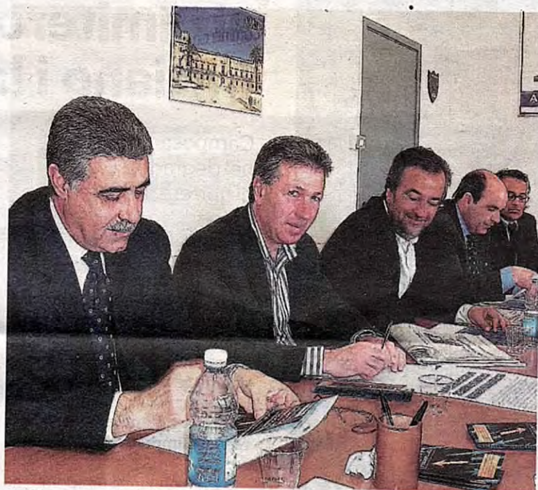
Confcommercio. I dirigenti della confederazione durante una riunione