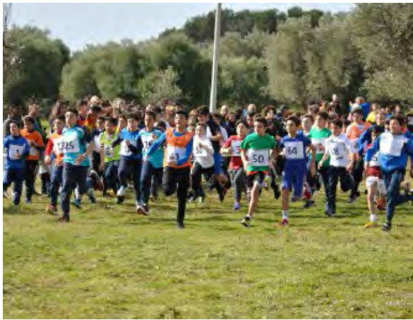
PARTENZA DELLA GARA DELLA CAT. RAGAZZI AL PARCO S. BARTOLO