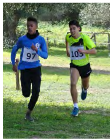
SPRINT FINALE TRA CASTILLO E CASIRARO