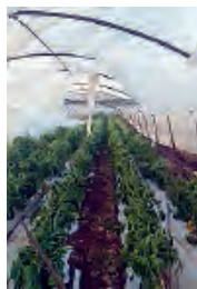
I danni provocati alle serre sono stati notevoli

Il forte vento ha scoperchiato le serre e sradicato gli alberi pure in città