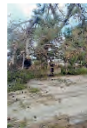
Numerosi gli alberi che sono finiti a terra