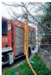
I vigili hanno risposto a centinaia di chiamate

Il maltempo dello scorso fine settimana ha devastato i campi