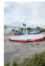
Scoperchiata la tettoia di un distributore