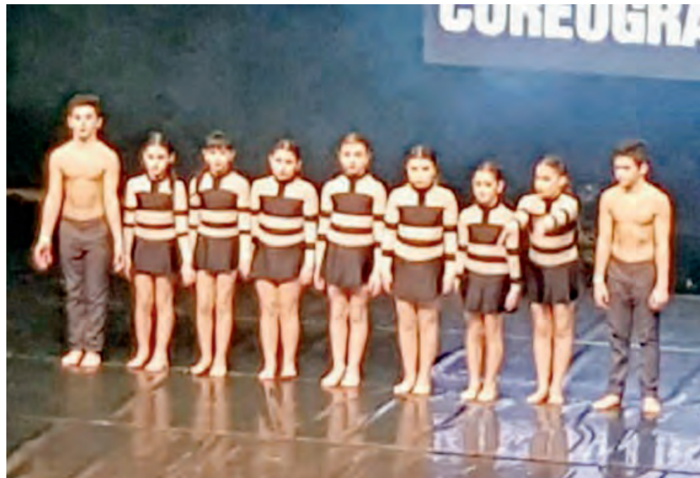
IL TEAM DEL CENTRO ARTE DANZA & FITNESS CHE HA OTTENUTO IL SECONDO POSTO A LIVELLO REGIONALE

Il nostro gruppo di Arte Danza & Fitness valutato da una parata di stelle