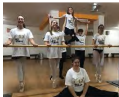
UN GRUPPO DELL'OLIMPO LATINO SCICLI