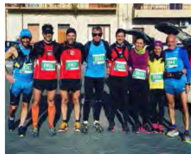
GRUPPO PADUA E BAROCCO RUNNING AL VIA