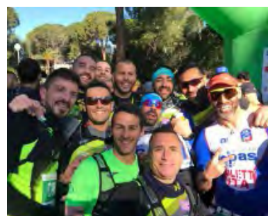
IL GRUPPO DELLA RUNNING MODICA