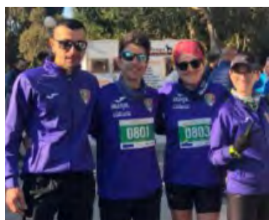
IL QUARTETTO DELL'UISP SANTA CROCE