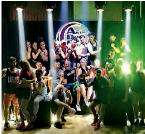
ALCUNI ISTRUTTORI E ALLIEVI DEL CENTRO

La sfida dei buoni propositi riguarda un poco tutti con l'ingresso del nuovo anno. A maggior ragione se questi buoni propositi hanno a che vedere con la forma fisica o con lo stato di benessere di ciascuno di noi, messi a dura prova durante il periodo delle feste. Ecco perché ci sono iniziative, come quella proposta del centro sportivo Arte Danza & Fitness di Vittoria, che guardano avanti. E soprattutto concedono a chi ha la volontà ma non ancora la possibilità di potere contare sulla spinta motivazionale essenziale, di ritagliarsi un momento tutto per sé e di guardare al rilancio della propria forma. Per questo, nella