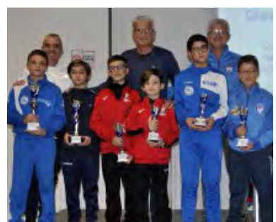
GP GIOVANI: I PREMIATI ESORDIENTI A M.