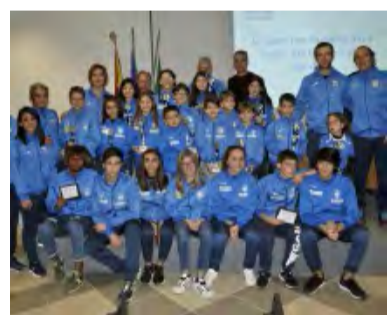
SOCIETÀ: ATLETI, TECNICI DIRIGENTI NO AL DOPING