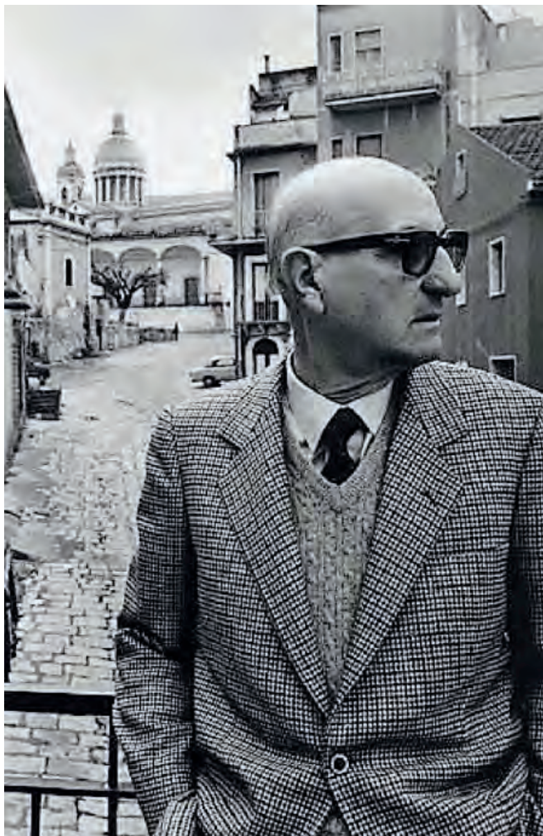
GESUALDO BUFALINO E UNO SCORCIO DELLA CITTÀ DI COMISO

"La strada è un happening di eventi dove tutto si muove e cambia - ha dichiarato Stefania Campo -. Ed ecco l'idea delle strade degli scrittori siciliani. Attraverso la loro istituzione sarà possibile visitare case museo o luoghi in cui hanno vissuto, entrare nei bar che frequentavano e magari assaporare un dolce che ha ispirato alcuni romanzi, visitare una piazza o ammirare uno scorcio e un paesaggio, che li ha ispirati".