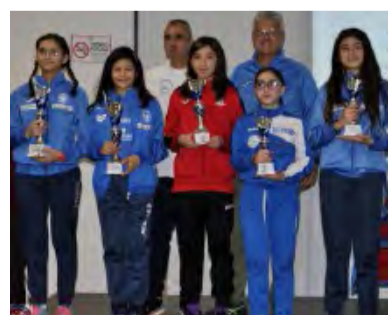
GP GIOVANI: I PREMIATI ESORDIENTI A F.