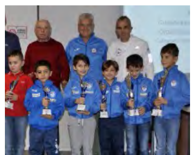
GP GIOVANI: I PREMIATI ESORDIENTI C M.