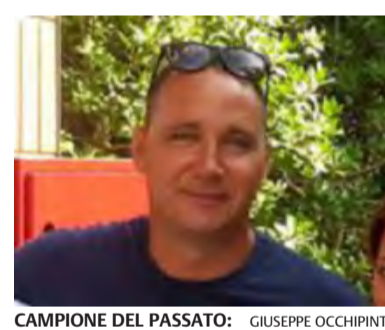
CAMPIONE DEL PASSATO: GIUSEPPE OCCHIPINTI