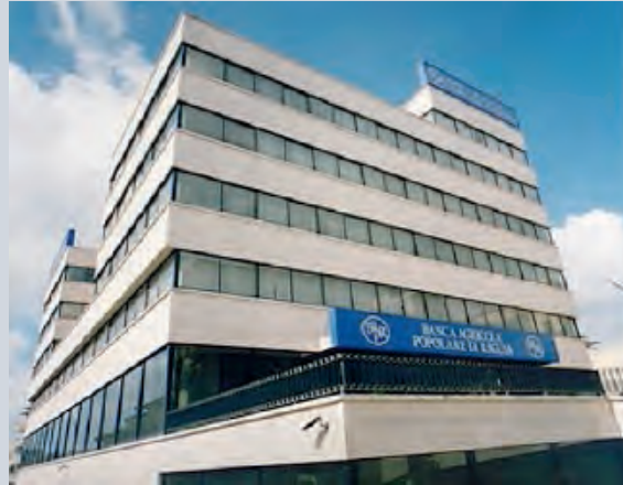
Resta convocato il sit in di domani dinanzi alla sede centrale della Bapr di Ragusa