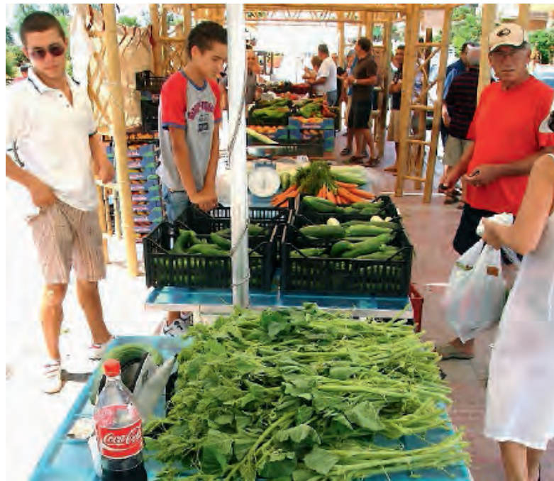
LA VENDITA DIRETTA DEI PRODOTTI AGRICOLI DOVREBBE ACCORCIARE LA FILIERA

"La vendita diretta dei prodotti agricoli - spiega Ragusa - rappresenterà un vantaggio sia per il produttore che per il consumatore, consentendo di accedere direttamente alle fonti di produzione, senza perdersi nella filiera degli intermediari. Con la norma, ogni Comune potrà istituire o autorizzare il luogo adibito alla vendita diretta finalizzata alla valorizzazione della tipicità e della provenienza dei prodotti venduti. Ogni produttore, dunque, potrà rivendere le proprie coltivazioni aggiungendo reddito complementare a quello che già normalmente produce, instaurando nel contempo un rapporto di fiducia e diretto con il consumatore che avrà l'opportunità di avere certezza della produzione locale, e quindi a chilometro zero, risparmiando negli acquisti rispetto alla tradizionale catena di distribuzione".